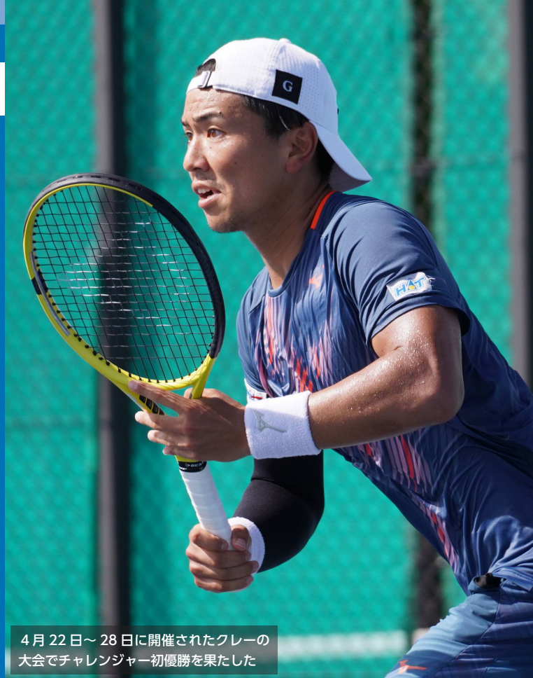
4月22日～28日に開催されたクレーの大会でチャレンジャー初優勝を果たした