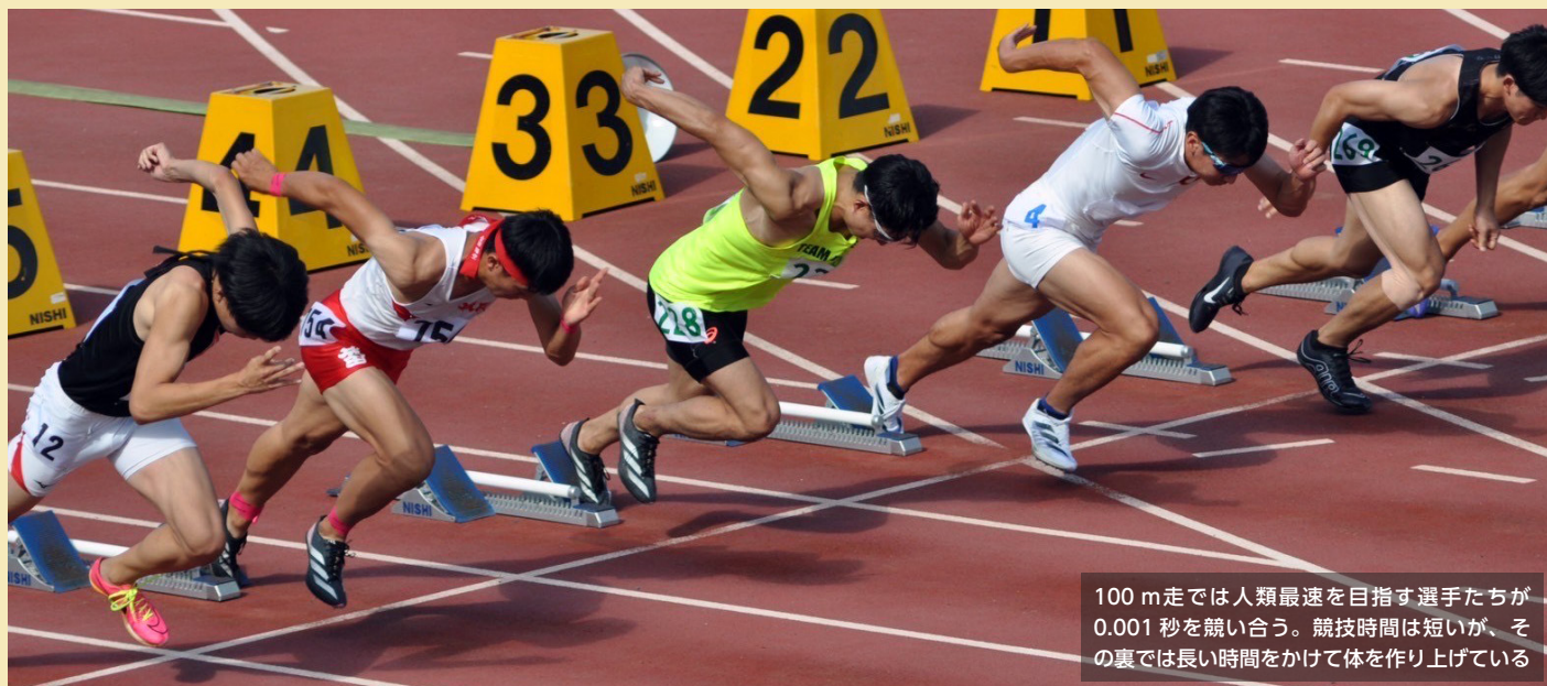
100m走では人類最速を目指す選手たちが0.001秒を競い合う。競技時間は短いですが、その裏では長い時間をかけて体を作り上げている