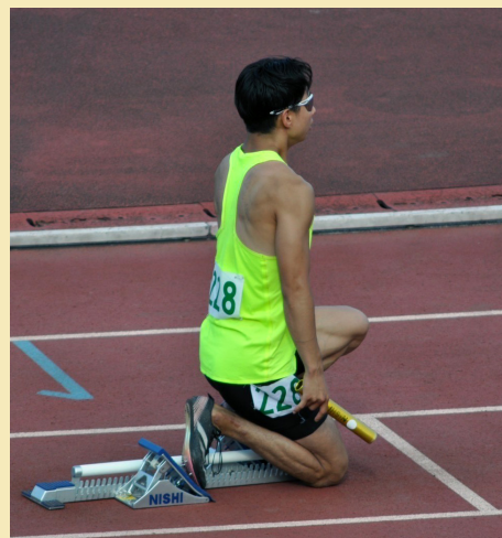
100mを4人で走るリレー競技では、バトンパスも時間短縮の重要な要素になる

100m走の自己ベストは10.53秒。第66回東日本実業団陸上競技大会で、4×100mリレー優勝。第77回千葉県選手権陸上競技大会では100mが3位、4×100mリレー優勝。第56回千葉県クラブ対抗陸上競技大会で100m優勝。